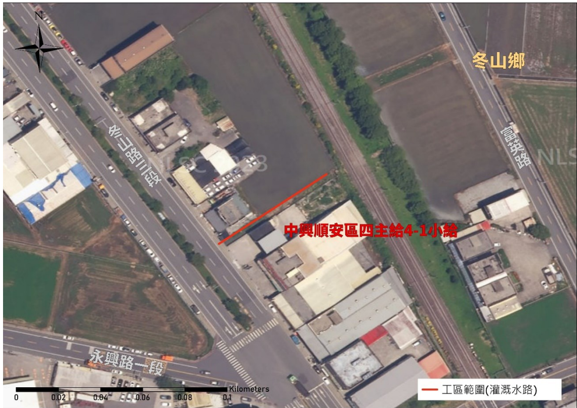
中興順安區四主給 4-1 小給