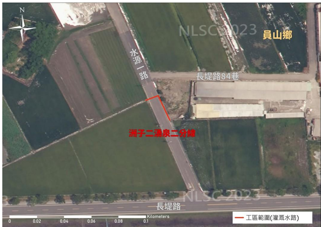
洲子二湧泉二分線