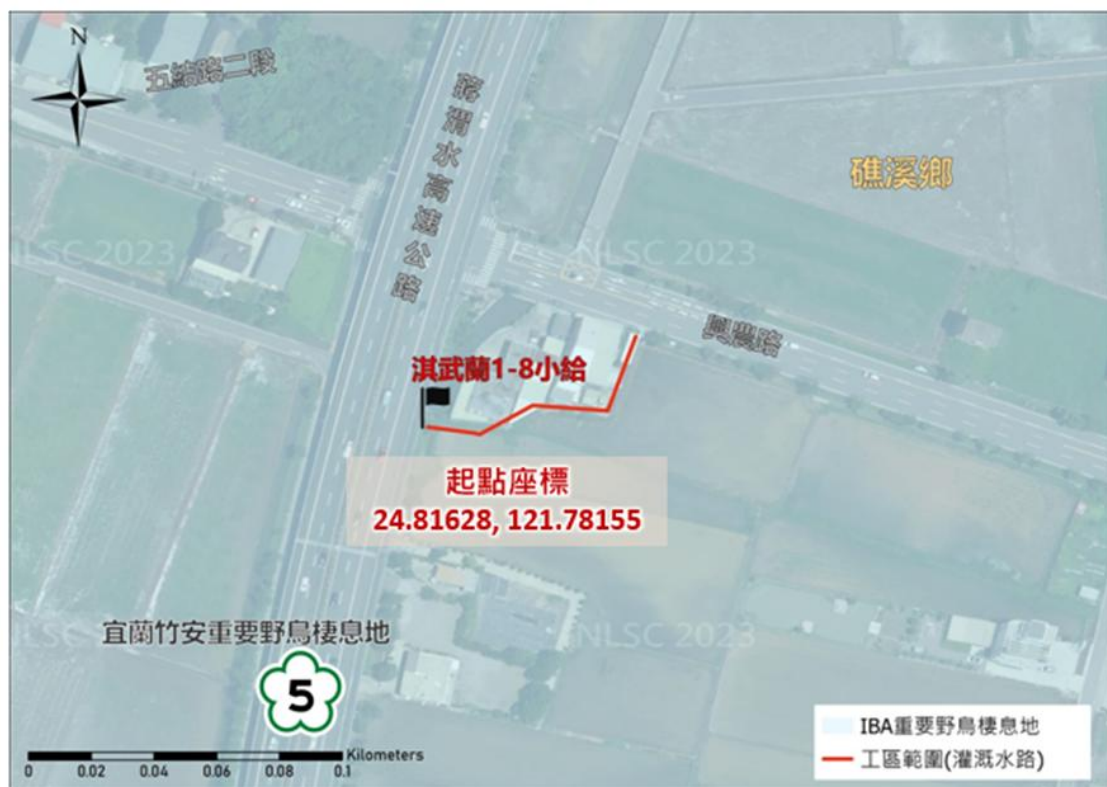
淇武蘭 1-8 小給