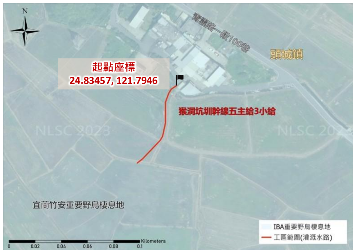
猴洞坑圳幹線五主給3小給