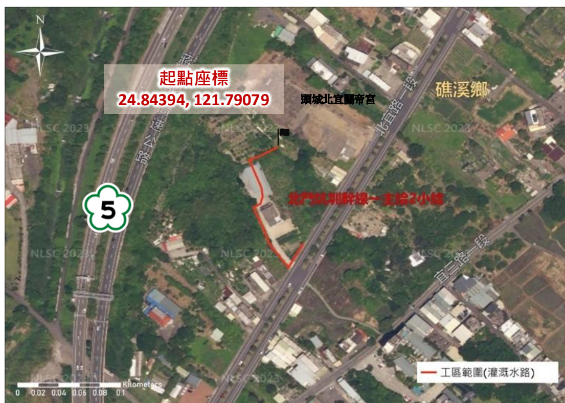
北門坑圳幹線一主給 2 小給